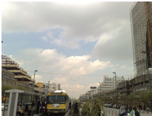
شکل ۳. نمونه‌ای از احداث ساختمان‌های بلند مشرف به حرم رضوی (ع)