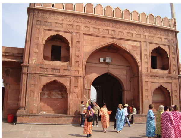
شکل ۸. مسجد دهلی (پذیرای گردشگران با شرایط خاص لباس از نظر پوشیدگی و برهنگی پاها)