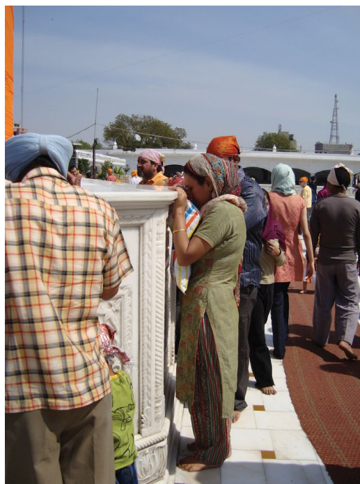
شکل ۹. رعایت آداب ورود به معبد سیکها با پاهای برهنه و سر پوشیده