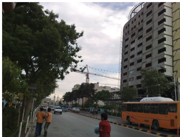
شکل ۲. نمونه‌ای از احداث ساختمان‌های بلند مشرف به حرم رضوی