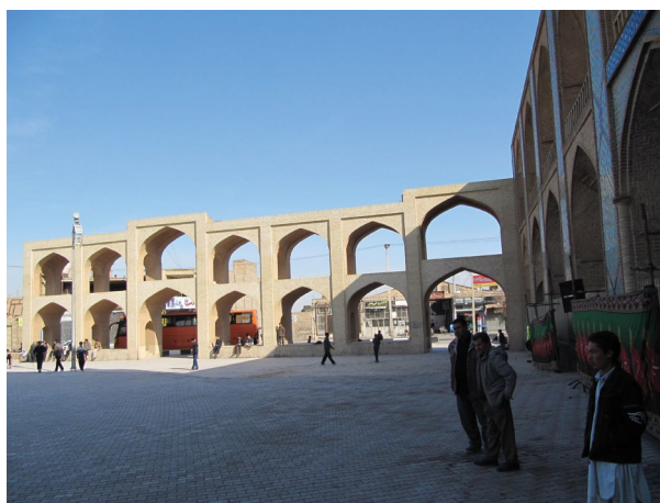
شکل ۴. فضای مناسب تکیه (یا حسینیه) برای برپایی آیین‌ها و حضور در همه‌ی سال