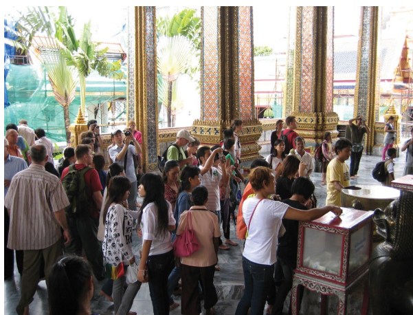
شکل ۷. معبدی بودایی (تایلند)