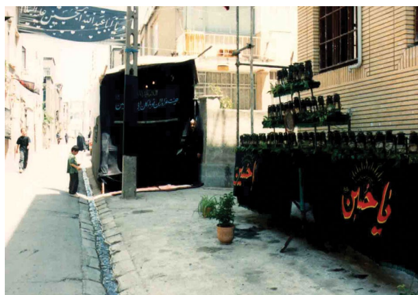
شکل ۵. فضای نامناسب تکیه (فقدان فضای مناسب در محله، مردم را به برپایی حداقل‌ها سوق می‌دهد)