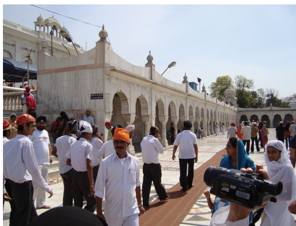
شکل ۶. معبد سیک‌ها (هند)