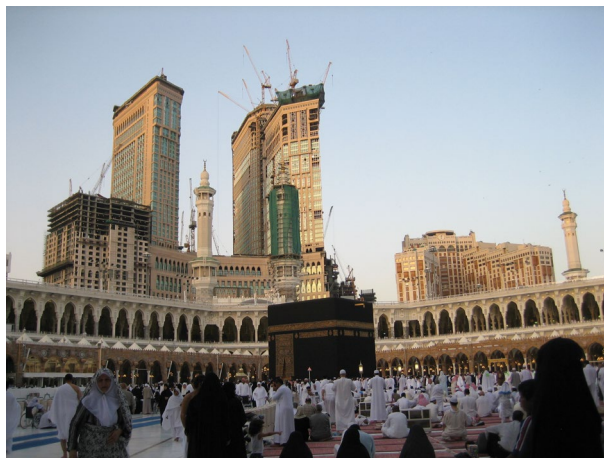
شکل ۱. مکه‌ی مکرمه (ساختمان‌های «بی‌ادبی» که یونسکو به آن اعتراض نمی‌کند)

میراث فرهنگی: توجه شود که میراث فرهنگی علاوه بر همه‌ی ویژگی‌هایی که برایش ذکر می‌شود، یک سرمایه‌ی اجتماعی و فرهنگی است. میراث فرهنگی سرمایه‌ی اولیه برای توسعه و پیشرفت فرهنگ و زمینه‌های وابسته به آن است. و این همان چیزی است که در دوران جهانی‌سازی جوامعی که می‌خواهند هویت خود را حفظ کنند سخت به آن محتاج هستند. این زمینه، به شدت متأثر از بیگانگان است و معیاری وجود ندارد. مثلاً مقایسه کنید، آنچه را که در اصفهان بر میدان نقش جهان رفته است، با اوضاع مکه‌ی مکرمه و مشهد مقدس را. در مورد میدان نقش جهان، علی‌رغم فاصله‌ی نسبتاً زیاد و حتی عدم سیطره‌ی ساختمان جهان‌نما بر میدان، با توجه به اعتراض