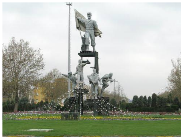
شکل (۶) میدان جانباز