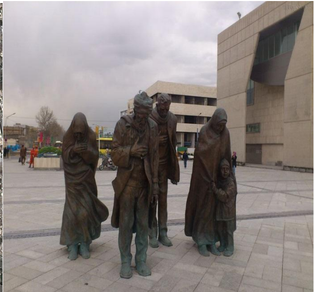
شکل (۱) مجسمه های سلام (میدان شهداء)