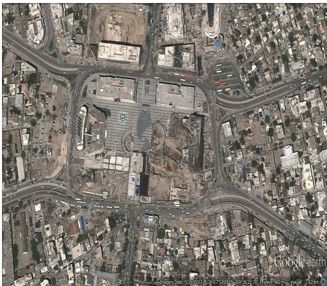
شکل (۲) google earth میدان شهداء

میدان شهدا یکی از پر رفت و آمدترین میداين شهر مشهد می باشد که سابقه آن به بیش از ۷۰ سال پیش بر می گردد. این میدان نقطه تلاقی سه شریان مهم ارتباطی شهر مشهد؛ خیابان امام خمینی(ره) به خواجه ربیع، خیابان توحید به شیرازی و خیابان هاشمی نژاد به دانشگاه. این سه محور از نظر کارکرد شهری ، خدماتی و هویت شهری اهمیت زیادی دارند و از سویی دیگر ساختمان شهرداری نقش مدنی بارزی به این میدان بخشیده است. مجسمه سلام به طراحی غلام رضا سهرابی در ۱۱ آبان ماه سال ۹۰ در این میدان نصب شده. مجسمه های برنزی سلام شامل ۴ پیکره است که با موضوع ادای احترام به ساحت مقدس رضوی ساخته شده اند . این مجسمه از مجموع نشانه های دائمی شهر مقدس مشهد است.