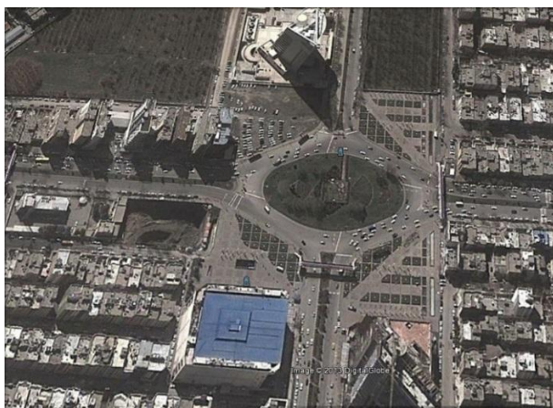
شکل (۷) google earth میدان جانباز

هر کدام از تندیس ها بیانگر موضوعی است. رزمنده بالای پایه، نماد جانبازی است که پرچم اسلام را بدست گرفته است و دیگری رزمنده ای است که مشت گره کرده و به طرف دشمن در حال تکبیر گفتن است. همچنین مجسمه سوم فرمانده است که فرمان حمله در صحنه جنگ را می دهد و آن یکی در حال هجوم به دشمن در مبارزه با سلاح های شیمیایی است و آخری رزمنده ای است که مجروح جنگی را در بغل دارد.