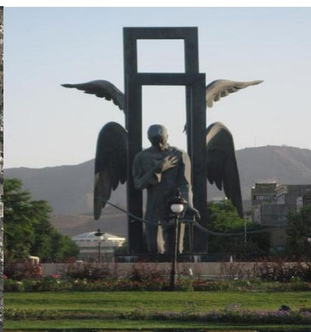
شکل (۳) فلکه ضد